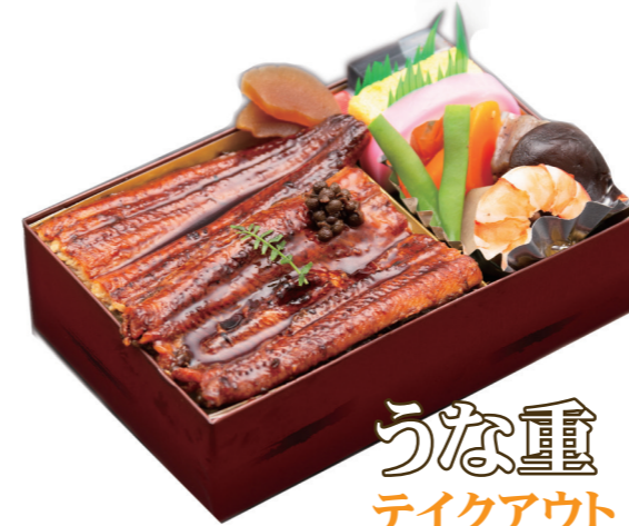
うなぎ重 テイクアウト 館内ご飲食 3,024円 / 3,080円