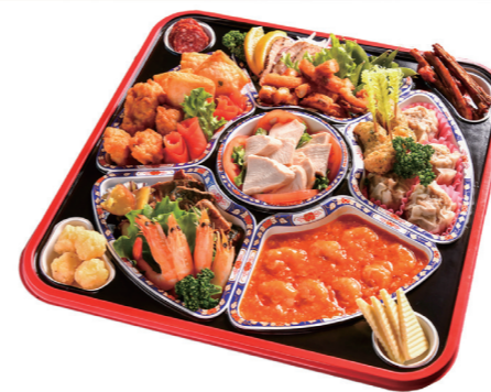
オードブル テイクアウト 5,400円 館内ご飲食 / 5,500円