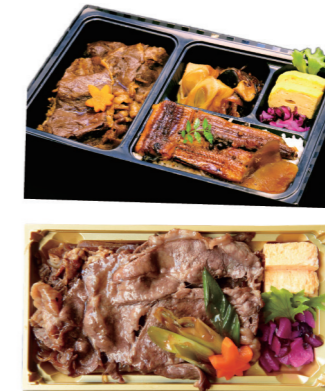
牛すきうなぎ重 テイクアウト 館内ご飲食 2,916円 / 2,970円 牛すき焼き重 テイクアウト 館内ご飲食 1,404円 / 1,430円