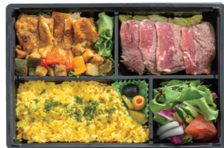
タンドリー チキン& サーロイン ステーキ弁当