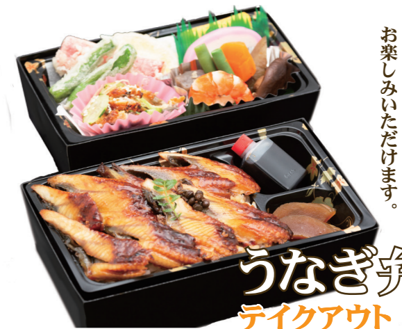
うなぎ弁当 テイクアウト 館内ご飲食 2,808円 / 2,860円