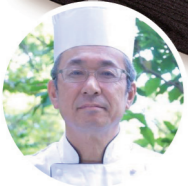
八田総料理長がつくる 牛サーロインステーキ弁当